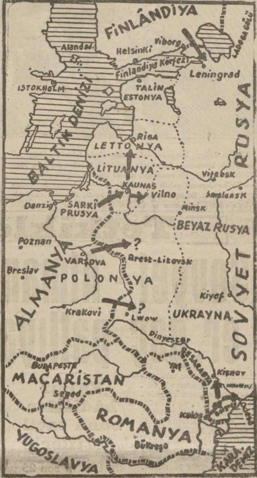
Harekât sahasını ve taarruz istikametlerini gösterir harita

Yedek sübay yetişebilirlik için, en aşağı, Lise veya muadili okul diploması alınması şart olduğundan, Orta Okul mezunları, kanunen, yedek sübay yetiştirilemezler. Binaenaleyh, bu mezunların ilgilili makamlara, başuna baş vurmamaları tebliğ olunur. (5050)