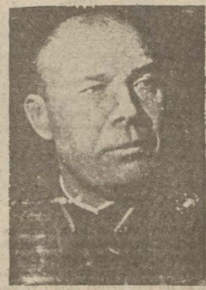
Rus orduları başkumandanı Timoşenko

Berlin, 23 (A.A.) — Alman orduları başkumandanlığının tebliği: Şarkta kara ve hava ordularının Kızıldünya karşı verdiği muharebeler plân mucibince ve muvaffakiyetle cereyan etmektedir.