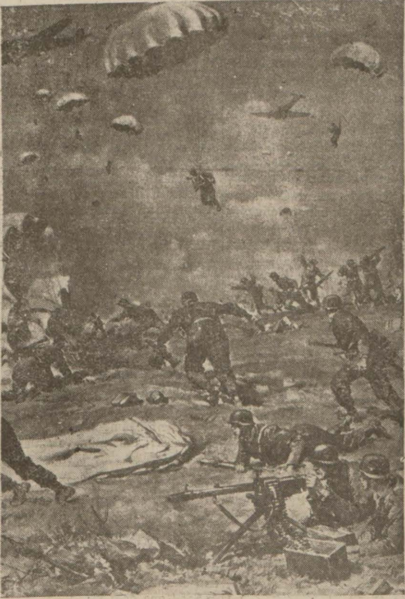
Alman parasütçülerinin, Gid harbindeki faaliyetini gösteren tebliğ resim

Nevyork 23 (A.A.) — Finlan- diyadan alınan haberler Rusyaya taarruzda Finlandiya kit'alarının Alman kit'aları ile temas etmedik- lerini göstermektedir. Finlandiya (Arkası sayfa 7 sütun 5 te)